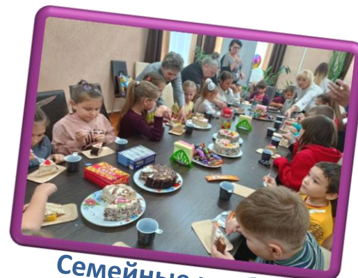
Семейные клубы, мероприятия и праздники