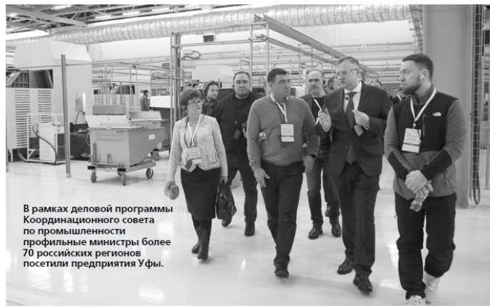
В рамках деловой программы Координационного совета по промышленности профильные министры более 70 российских регионов посетили предприятия Уфы.

Они ознакомились с производственным процессом и проектами, пообщались с директорами заводов и управляющих компаний индустриального парка и технопарка.